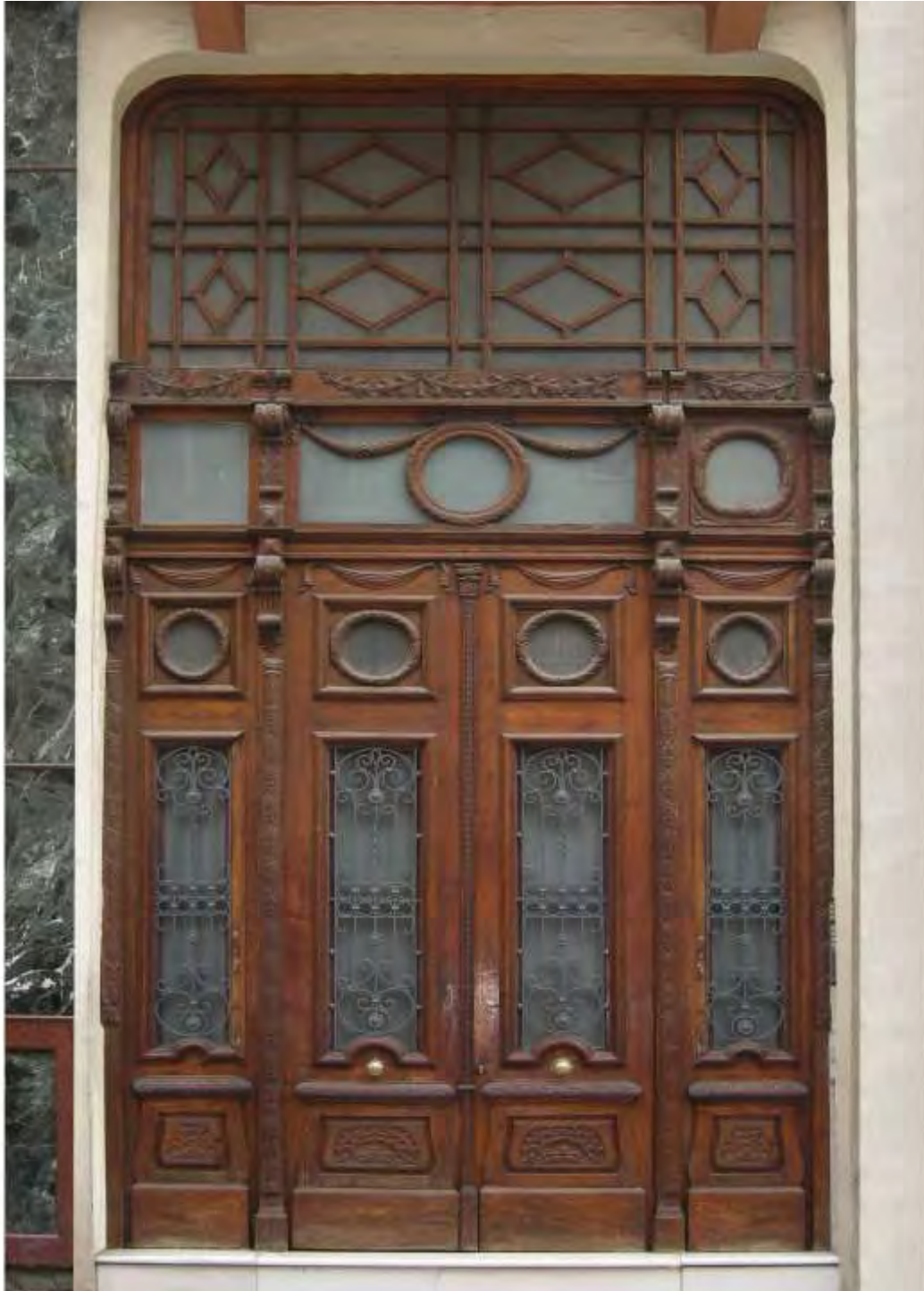
Πόρτα στην είσοδο πολυκατοικίας στη διασταύρωση των οδών Τσιμισκή και Αγίας Σοφίας στη Θεσσαλονίκη

Οι ξυλουργοί της Σιάτιστας δεν περιορίστηκαν σε εργασίες μόνο μέσα στην πόλη της Σιάτιστας. Καθηγήτρια του Α.Π.Θ. με καταγωγή από τη Σιάτιστα, μας πληροφόρησε πως σιατιστινοί ξυλουργοί κατασκεύασαν μια πολύ εντυπωσιακή πόρτα για την είσοδο μιας από τις πολυκατοικίες που κτίστηκαν στις αρχές του 20 ου αιώνα και που βρίσκεται στη συμβολή των οδών Τσιμισκή και Αγίας Σοφίας στη Θεσσαλονίκη.