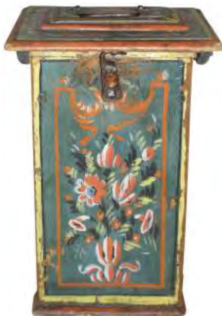
Καναβέτα για ένα μπουκάλι κρασί

Γνωρίζουμε πως το σιατιστινό κρασί αποτελούσε πολύτιμο δώρο σε πολλές περιστάσεις. Οι Σιατιστινοί έστελναν το κρασί τους ως δώρο, τοποθετώντας τα μπουκάλια σε ξύλινα ή χάλκινα κιβωτιάκια, τις καναβέτες. Μάλιστα την πρώτη αναφορά για καναβέτα χαλκωματένια την συναντήσαμε σε έγγραφο διανομής περιουσίας του 1697 στον κώδικα Ζωσιμά 1 . Σήμερα σε πολλά σιατιστινά σπίτια σώζονται καναβέτες κυρίως ξύλινες.