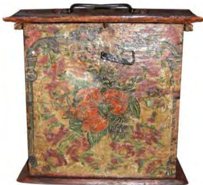
Καναβέτα διπλή, για δύο μπουκάλια κρασί