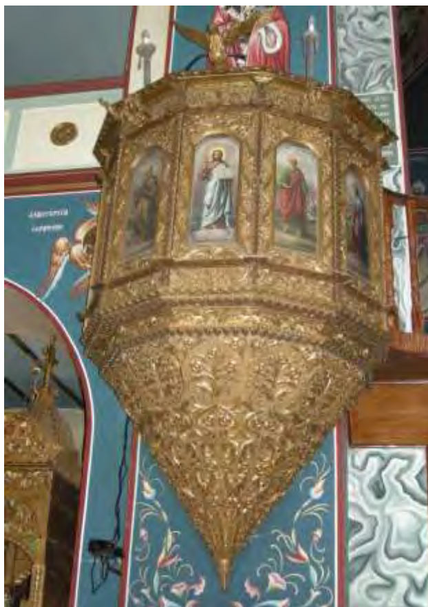
Ο άμβωνας του ναού του Αγίου Δημητρίου

Ένα σπουδαίο έργο ξυλογλυπτικής που κατασκευάστηκε από ξυλουργούς της Σιάτιστας, είναι ο άμβωνας του ναού Αγίου Δημητρίου Σιάτιστας. Κατασκευάστηκε από τον Παύλο Ταχμιντζή και το γιο του Δημήτριο, με τόση επιμέλεια και δεξιοτεχνία που απέσπασαν τα συγχαρητήρια του αρχιτέκτονα Αριστοτέλη Ζάχου.